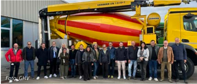
Die Mitglieder des Gewerbe- und Handelsvereins zeigten sich beeindruckt bei der Betriebsführung bei Liebherr.

Am Freitag, 17. Oktober 2025 veranstaltete der Gewerbe- und Handelsverein Bad Schussenried einen rundum gelungenen Unternehmerabend bei der Firma Liebherr Mischtechnik GmbH. Bereits beim Empfang war deutlich spürbar: Hier trifft regionale Verwurzelung auf globale Innovationskraft.