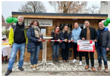
Offizielle Eröffnung des Fairteilers in Bad Schussenried.

Der neue Fairteiler bietet Bürgerinnen und Bürgern künftig die Möglichkeit, überschüssige, noch einwandfreie Lebensmittel kostenlos mitzunehmen oder abzugeben. Unter dem Motto „Teilen statt verschwenden“ soll er zu einem Ort werden, an dem Nachhaltigkeit, Verantwortung und Gemeinschaft praktisch gelebt werden. Ein Fair-Teiler ist ein öffentlich zugänglicher Raum, in dem Lebensmittel, die nicht mehr verkauft werden können oder privat überschüssig sind, abgelegt und von anderen entnommen werden können – ganz ohne finanzielle Transaktionen. In Bad Schussenried wird dieser Fairteiler eine Hütte von 3 x 4 Metern umfassen, ausgestattet mit einem Kühlschrank und Regalen. So können verderbliche sowie nicht verderbliche Lebensmittel problemlos abgelegt und für jedermann zugänglich gemacht werden.