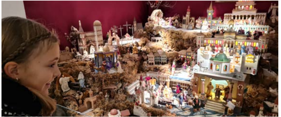
Stimmungsvolle Ausstellungen zur Weihnachtszeit: Krippen im Kloster Schussenried